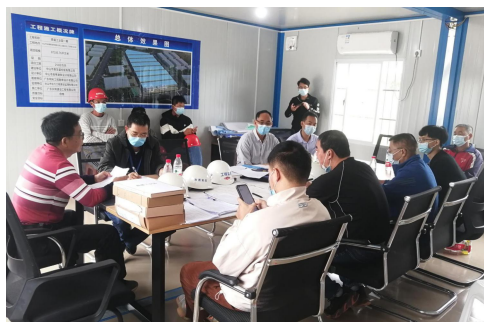
台山市住房和城乡建设局检查“中山市鼎至盛控股有限公司鼎盛工业园一期工程”

台山市住房和城乡建设局对“中山市鼎至盛控股有限公司鼎盛工业园一期工程”开展“两场联动”检查。检查过程中，主要管理人员到位。存在问题有：1.未独立设置工地饭堂，未配备宿舍区及饭堂的消防灭火器，无消防栓。2.未进行消防演练。3.无动火审批手续及相关资料。4.会议室后面堆放挤塑板，位置不合理。5.外脚手架刚性连墙件不符合要求，出入口防护棚不符合要求。6.起重设备管理卷扬机、平衡块位置防护措施不符合要求。7.笼口防护棚不符合要求。