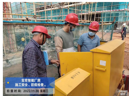
鹤山市住房和城乡建设局检查 “广东实密智能装备有限公司 1#厂房、2#厂房、办公楼、门 卫”

恩平市住房和城乡建设局对“广东实密智能装备有限公司 1#厂房、2#厂房、办公楼、门卫”开展“两场联动”检查。检查过程中，主要管理人员到位。发现问题有：1.塔吊底部围蔽不符合要求。2.塔吊开关箱漏电保护开关额定动作电流大于 30mA 不符合要求（现场 150mA），未